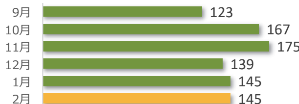
相談件数の推移（直近 6 か月）

2 月の相談件数は 145 件で、相談者の内訳は医療機関が 65 件、遺族等が 72 件、その他・不明が 8 件でした。 遺族等の求めに応じて相談内容をセンターが医療機関へ伝達したものは 2 件（累計 159 件）でした。 医療機関から医療事故の判断について相談を受け、センター合議を開催し、医療機関へ助言したものは 6 件（累計 444 件）でした。