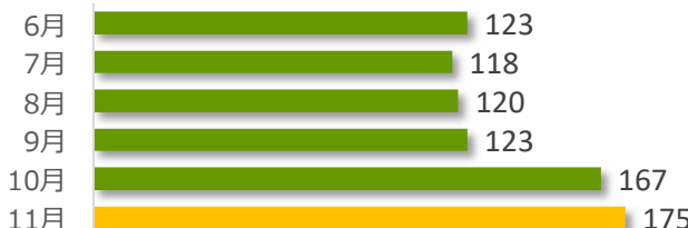
相談件数の推移（直近6か月）

11月の相談件数は175件で、相談者の内訳は医療機関が73件、遺族等が90件、その他・不明が12件でした。遺族等の求めに応じて相談内容をセンターが医療機関へ伝達したものは1件（累計152件）でした。医療機関から医療事故の判断について相談を受け、センター合議を開催し、医療機関へ助言したものは3件（累計428件）でした。