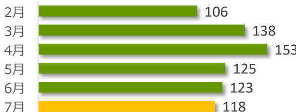
相談件数の推移（直近 6 か月）

7 月の相談件数は 118 件で、相談者の内訳は医療機関が 65 件、遺族等が 47 件、その他・不明が 6 件でした。遺族等の求めに応じて相談内容をセンターが医療機関へ伝達したものは 1 件（累計 142 件）でした。医療機関から医療事故の判断について相談を受け、センター合議を開催し、医療機関へ助言したものは 3 件（累計 415 件）でした。