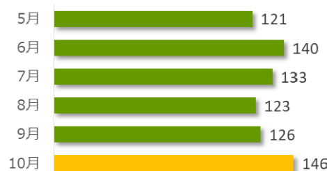
相談件数の推移（直近6か月）

10月の相談件数は146件で、相談者の内訳は医療機関が71件、遺族等が70件、その他・不明が5件でした。遺族等の求めに応じて相談内容をセンターが医療機関へ伝達したものは0件（累計135件）でした。医療機関から医療事故の判断について相談を受け、センター合議を開催し、医療機関へ助言したものは1件（累計377件）でした。