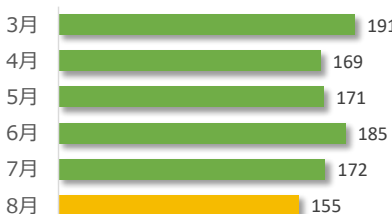
相談件数の推移（直近 6 か月）

遺族等の求めに応じて相談内容をセンターが医療機関へ伝達したものは 4 件でした。（累計 57 件）