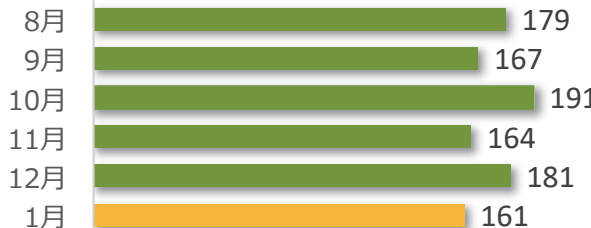
相談件数の推移（直近 6 か月）

1 月の相談件数は 161 件で、相談者の内訳は医療機関が 79 件、遺族等が 80 件、その他・不明が 2 件でした。 遺族等の求めに応じて相談内容をセンターが医療機関へ伝達したものは 1 件（累計 180 件）でした。 医療機関から医療事故の判断について相談を受け、センター合議を開催し、医療機関へ助言したものは 7 件（累計 512 件）でした。