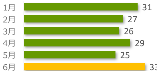
医療事故報告件数の推移（直近 6 か月）

6 月は事故発生の報告が 33 件ありました。 病院・診療所別では、病院からの報告が 32 件、診療所からの報告が 1 件でした。