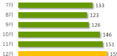
相談件数の推移（直近 6 か月）

12 月の相談件数は 159 件で、相談者の内訳は医療機関が 65 件、遺族等が 87 件、その他・不明が 7 件でした。 遺族等の求めに応じて相談内容をセンターが医療機関へ伝達したものは 1 件（累計 136 件）でした。 医療機関から医療事故の判断について相談を受け、センター合議を開催し、医療機関へ助言したものは 7 件（累計 388 件）でした。