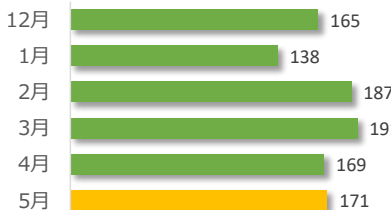
相談件数の推移（直近 6 か月）

遺族等の求めに応じて相談内容をセンターが医療機関へ伝達したものは 3 件でした。（累計 49 件）