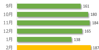
相談件数の推移（直近 6 か月）

遺族等の求めに応じて相談内容をセンターが医療機関へ伝達したものは 2 件でした。（累計 38 件）