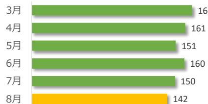
相談件数の推移（直近 6 か月）

遺族等の求めに応じて相談内容をセンターが医療機関へ伝達したものは 4 件でした。（累計 26 件）